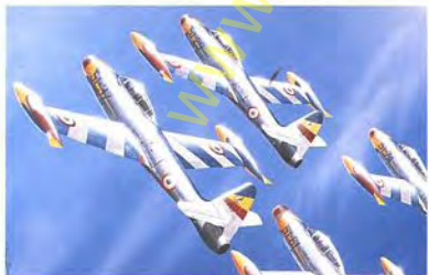
Tigri bianche 1955-56 F-84G "Thunderjet"