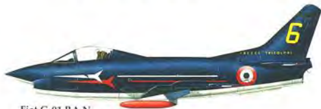
Fiat G-91 P.A.N.