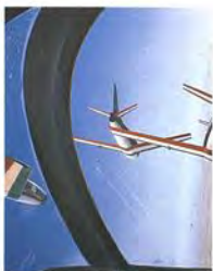
Lancieri Neri 1958-59