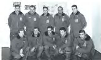
GIARDINI LIVERANI CUMIN LINGUINI COLUCCI TURRA ANTICOLI GOLDONI FERRAZZUTTI BARBINI