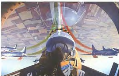
Frecce Tricolori 1963-81 FIAT G-91 "P.A.N."