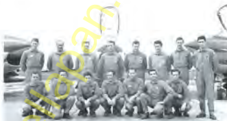
BARBINI LINGUINI BONOLLO DI LOLLO SCHIEVANO ANTICOLI FERRAZZUTTI GIARDINI PURPURA CUMIN MEACCI FRANZOI ZANAZZO