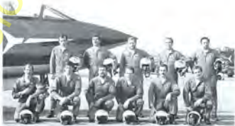
VALORI MONTANARI SALVI GALLUS PURPURA DE PODESTÀ RAINERI LIVA BROVEDANI POSCA MOLINARO