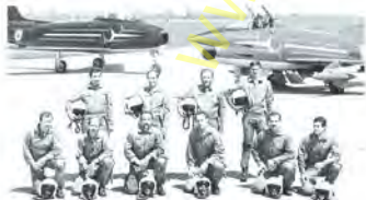
MONTANARI GALLUS SALVI RAINERI MOLINARO DE PODESTÀ ACCORSI BROVEDANI POSCA GORGA