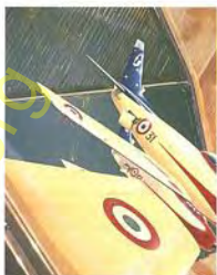
Cavallino Rampante 1956-57