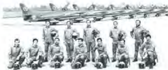
BERNARDIS GALLUS BARBERIS GADDONI BOSCOLO VALORI RUGGIERO LIVA MONTANARI SODDU CARRER PETRI