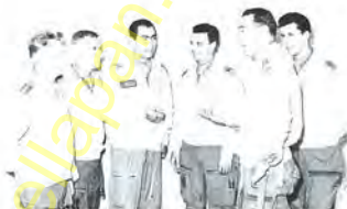
TURRA ANTICOLI PISANO CUMIN PANARIO FERRAZZUTTI