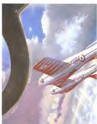
Diavoli Rossi 1957-59