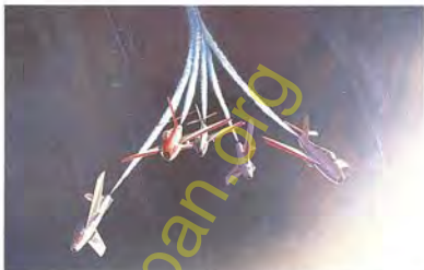
Getti Tonanti 1959-60 F-84F "Thunderstreak"