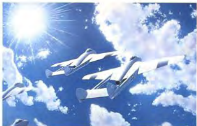
Cavallino Rampante 1950-52 DH "Vampire"