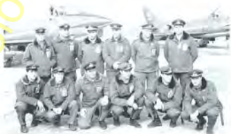
ANTICOLI LINGUINI GOLDONI DI LOLLO CUMIN GIARDINI MEACCI TURRA LIVERANI BARBINI FERRAZZUTTI SCHIEVANO