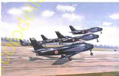
Frecce Tricolori 1961-63 F-86E "Sabre"