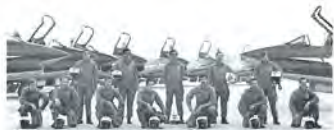
BERNARDIS MONTANARI BARBERIS GALLUS VALORI DIPAULI BROVEDANI RAINERI RUGGIERO PETRI PURPURA POSCA