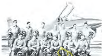
MONTANARI SANTILLI FRANZOI SBURLATI PURPURA GALLUS FERRAZZUTTI CARUSO PETTARIN JANSA BONOLLO ZARDO GAYS