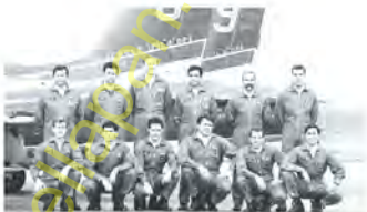
GROPPERLO MORETTI LORENZETTI MONTANARI ACCORSI TRICOMI WALZ VIVONA MINISCALCO GUZZETTI ROSA COGGIOLA